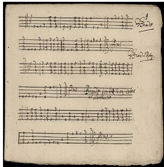
Exemplu de partitură din secolul al XVI