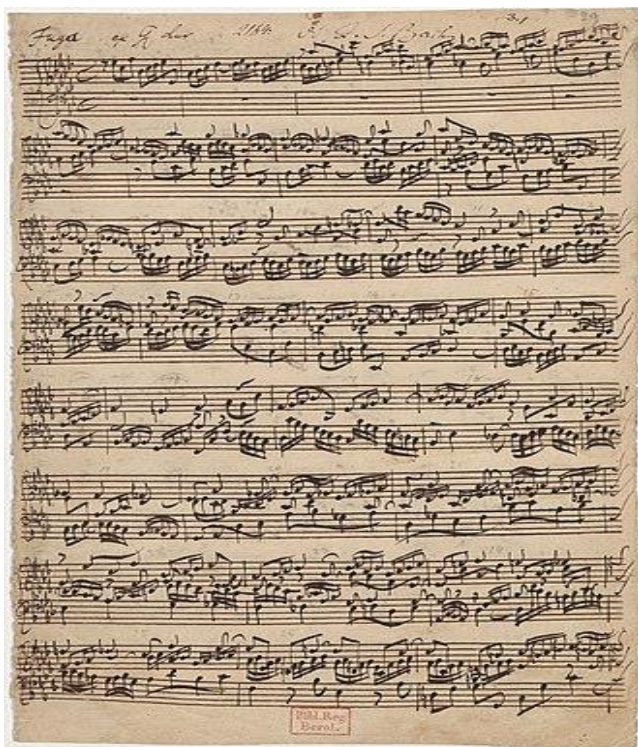
O pagină din partitura Fuga nr. 17 din J.S. Bach's Clavier bine temperat .