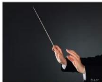
Gest dirijoral pentru decrescendo