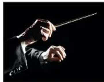
Gest dirijoral de închidere