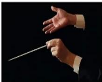
Gest dirijoral pentru crescendo

Astfel, dirijorul este cel care deține o privire de ansamblu a lucrării muzicale, cunoaște toate detaliile și nuanțele existente, pentru a le putea reinterpretă în manieră proprie, fără să se abată de la direcția și indicațiile originale ale compozitorului.